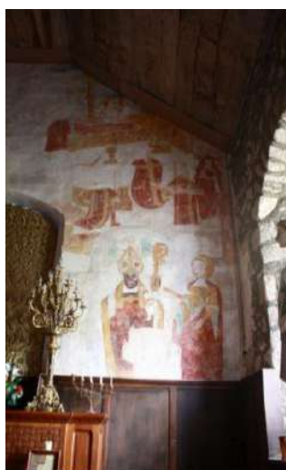
Photo 2 : Vue intérieure du chevet du chœur et des fresques.

La Chapelle Saint-Pierre d'Iné contient une peinture murale représentant une scène historique supportée par un mur de chevet protégé au titre des Monuments Historiques.