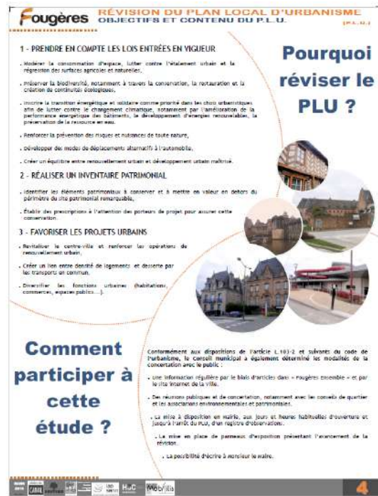
Panneaux d'exposition présentés en début de procédure - 2019