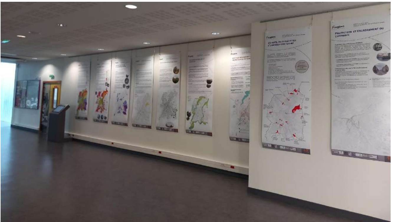
Panneaux exposés aux Ateliers – Hiver 2023-2024

L'ensemble des panneaux ont été mis à disposition sur la page internet dédiée.