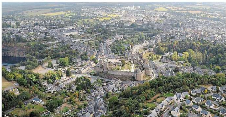
La ville de Fougères vue du ciel.

Eric Besson rappelle par ailleurs que le taux de logements vacants s'est « écroulé » en un peu moins de dix ans, passant de 13 % à 8,7 % de