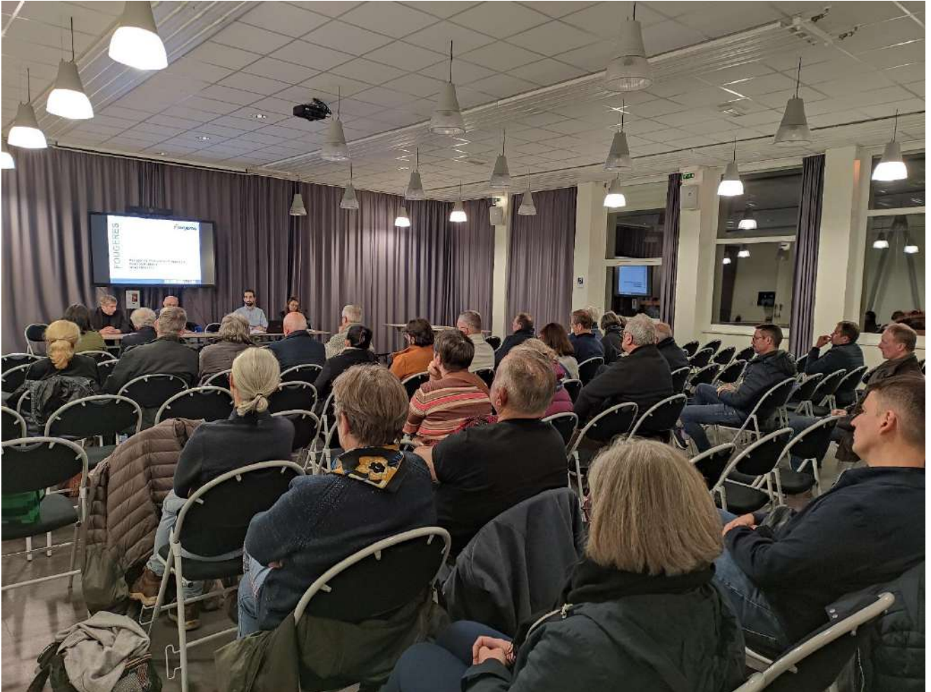
Réunion publique n°2 du 28 novembre 2023 - en présence d'une quarantaine de participants.