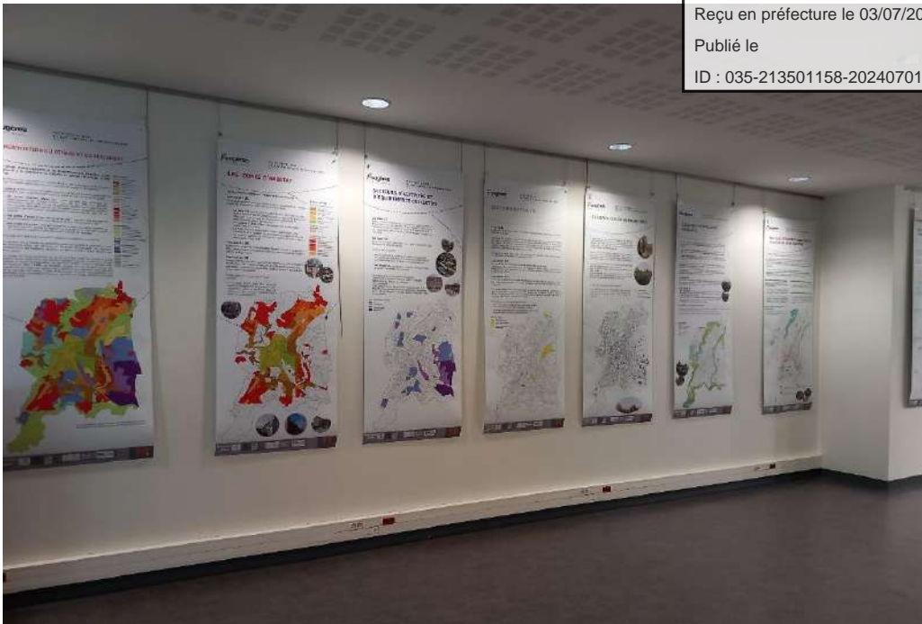
Panneaux exposés aux Ateliers – Hiver 2023-2024