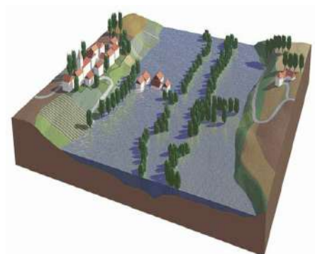
Lit majeur d'un cours d'eau (Enveloppe des crues retenue pour les AZI)