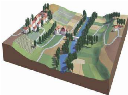
Lit mineur d'un cours d'eau (Espace d'écoulement en situation normale)

Représentation des limites des zones inondables: