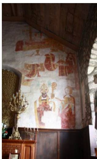
Photo 2 : Vue intérieure du mur du chevet et ses fresques, classé au titre des Monuments Historiques

La Chapelle Saint-Pierre d'Iné contient une peinture murale représentant une scène historique supportée par un mur de chevet protégé au titre des Monuments Historiques.