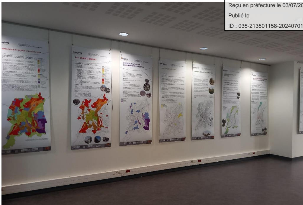
Panneaux exposés aux Ateliers – Hiver 2023-2024