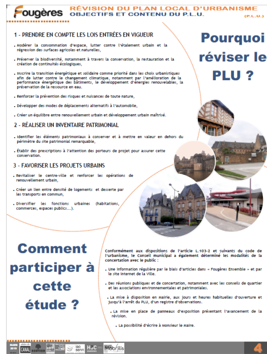
Panneaux d'exposition présentés en début de procédure - 2019