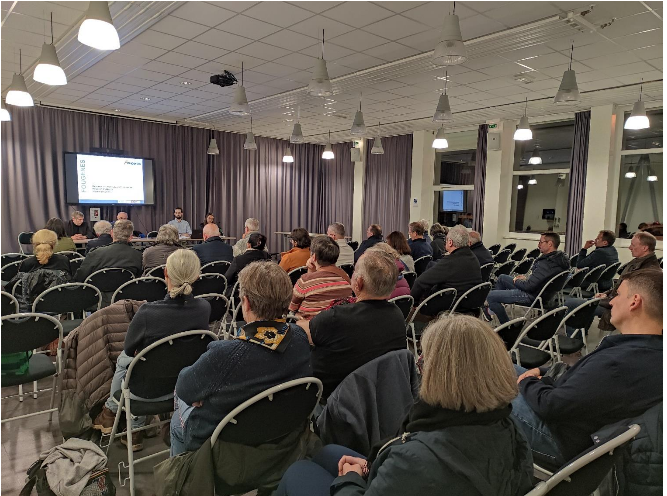
Réunion publique n°2 du 28 novembre 2023 - en présence d'une quarantaine de participants.