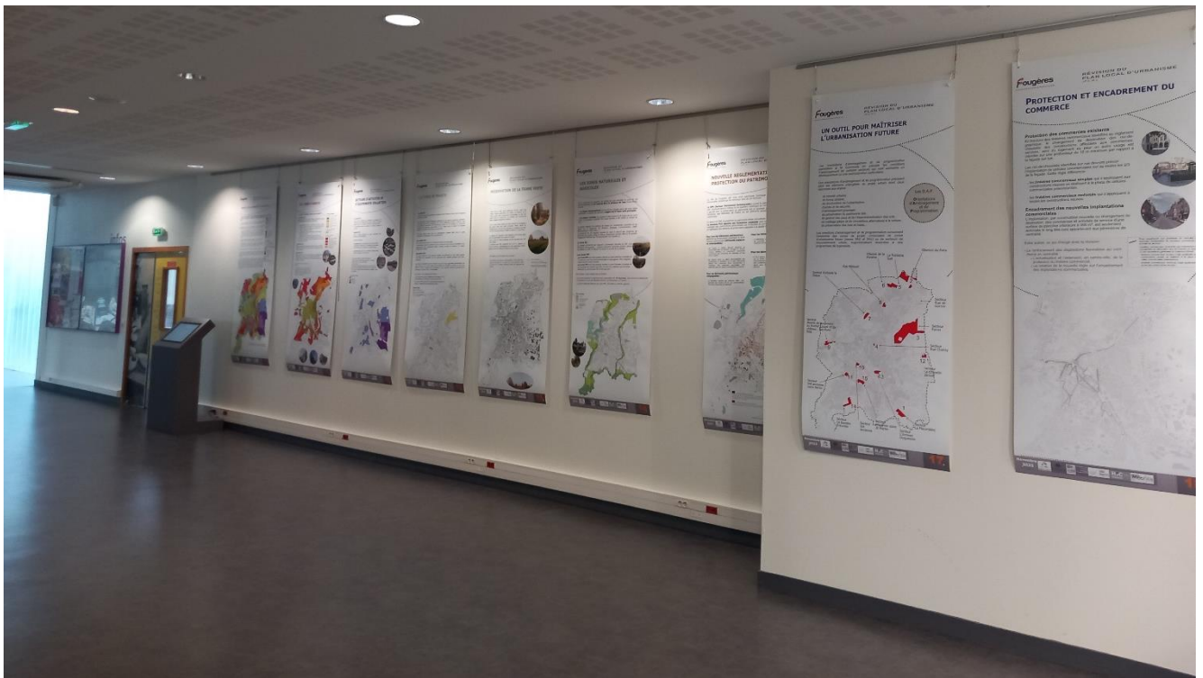
Panneaux exposés aux Ateliers – Hiver 2023-2024

L'ensemble des panneaux ont été mis à disposition sur la page internet dédiée.