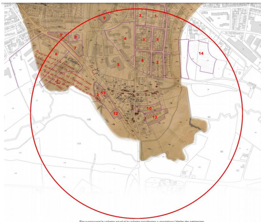
Plan superposant le cadastre actuel et le cadastre napoléonien + annotations l'Atelier des patrimoines

et de mise en valeur du patrimoine culturel. ». Le périmètre de cette servitude est un cercle de rayon de 500 mètres autour du monument.